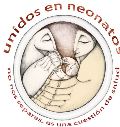
Figura 1. Logo para la campaña "Unidos en neonatos", diseño de Gloria Lizano

La campaña "Stop Kristeller: cuestión de gravedad" tiene como objetivo poner de relieve los riesgos de la maniobra de Kristeller que, estando desaconsejada por la SEGO y el Ministerio de Sanidad, se realiza en los hospitales públicos españoles en al menos un 26% de los partos.