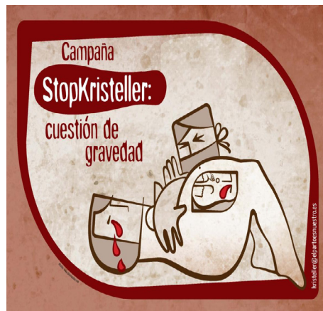
Figura 2. Logo para la campaña Stop Kristeller, diseño de Rosa de la Nava

La campaña "Stop Kristeller: cuestión de gravedad" tiene como objetivo poner de relieve los riesgos de la maniobra de Kristeller que, estando desaconsejada por la SEGO y el Ministerio de Sanidad, se realiza en los hospitales públicos españoles en al menos un 26% de los partos.